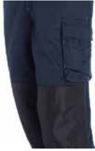
DOBLE TELA EN RODILLAS