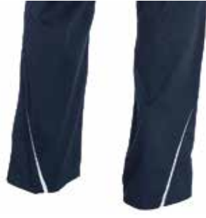
DETALLE REFLECTANTE EN TOBILLOS