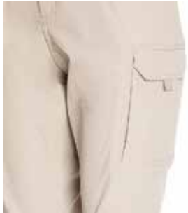
BOLSILLO CARGO CON TAPETA